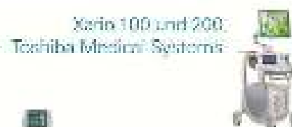
Xera 100 und 200 Toshiba Medical Systems