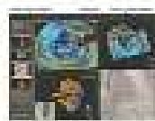
EchoNavigator Philips Austria GmbH, Healthcare