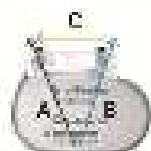
BioMonitor BIOTRONIK Vertriebs GmbH