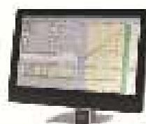
CARDIO/IT CS-200 Office SCHILLER Handelsgesellschaft m.b.H.