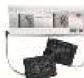
boso Carat synthro Boso GmbH & Co KG