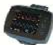
SOMNObuch NBP SOMNOmedica GmbH

Besuchen Sie unsere Rubrik Medizintechnik-Produkte