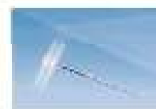
ELVeS Radial™ Lasersystem bioline AG

Die neue Rubrik im Journal für Kardiologie: Clinical Shortcuts