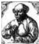
Theophrastus von Hohenheim (1493–1541), genannt Paracelsus

Der Paracelsus Preis der Österreichischen Gesellschaft für Innere Medizin 2016 ist mit Euro 5.000,– (klinisch) dotiert und wird für eine hervorragende wissenschaftliche Arbeit auf dem Gebiet der Inneren Medizin an Mitglieder der Österreichischen Gesellschaft für Innere Medizin verliehen.